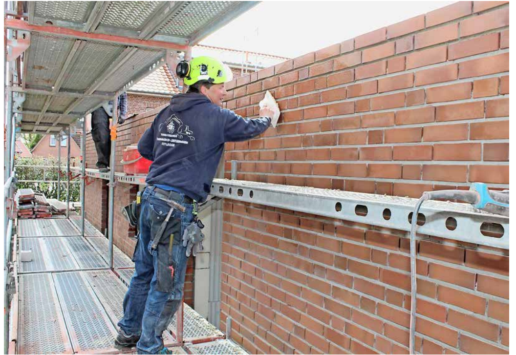
Die Wirtschaftslage des Bauhauptgewerbes hat sich gegenüber dem Vorjahr deutlich verbessert. Mit einem Geschäftsklimaindex von 111 Punkten nimmt die Branche eine der Spitzenpositionen auf der Skala ein.